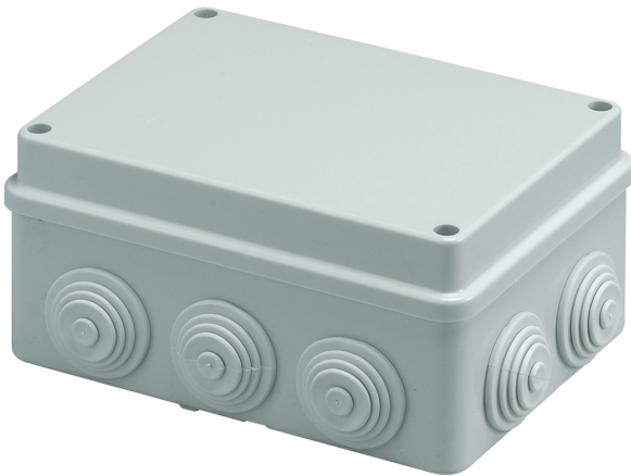
Vista Lateral exterior