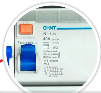
PROTECCIÓN DIFERENCIAL 4X40 30mA