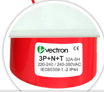
ENCHUFE INDUSTRIAL EMBUTIDO MACHO 3P+N+T, 32A, 380V IP44