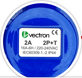
ENCHUFE INDUSTRIAL HEMBRA EMBUTIDA 2P+T, 16A, 220V IP44