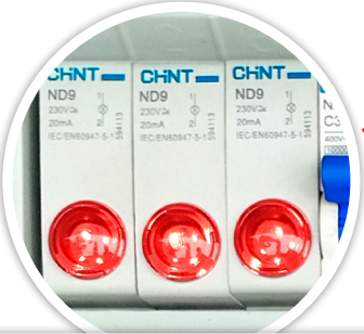
LUZ PILOTO RIEL DIN