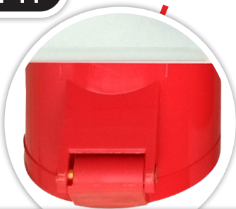
ENCHUFE INDUSTRIAL EMBUTIDO HEMBRA 3P+N+T, 32A, 380V IP44