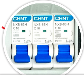
INTERRUPTOR 1, 2, 3 DE 1X16A 10KA