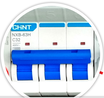
INTERRUPTOR GENERAL DE 3X32A 10KA