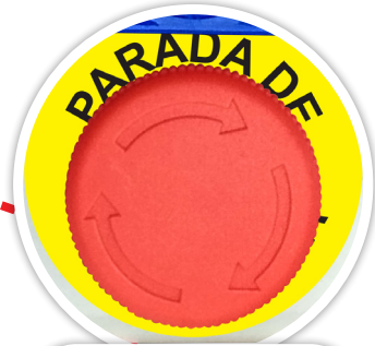
PARADA DE EMERGENCIA